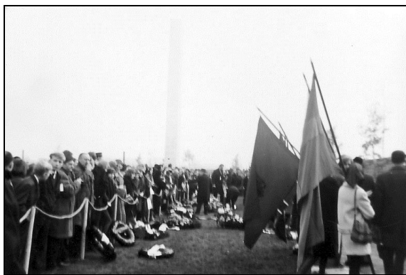
Tidligere fanger ved afsløringen af mindestenen.