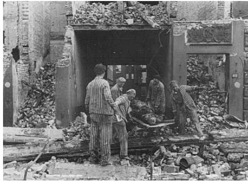
Fanger fra Neuengamme rydder op efter allieret bombning.