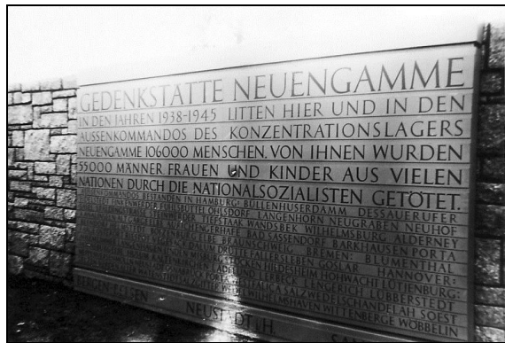
Mindestenen i fangelejren Neuengamme.