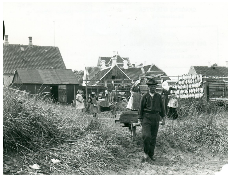
Hele familien hjælper til med at transportere, rense og tørre fisk. Brøndums Hotels nye tilbygning anes i baggrunden. Foto fra slutningen af 1800-tallet.