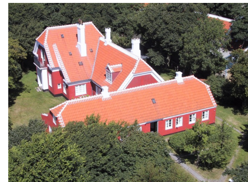
Malerparret Michael og Anna Anchers hus Skagens Kunstmuseer