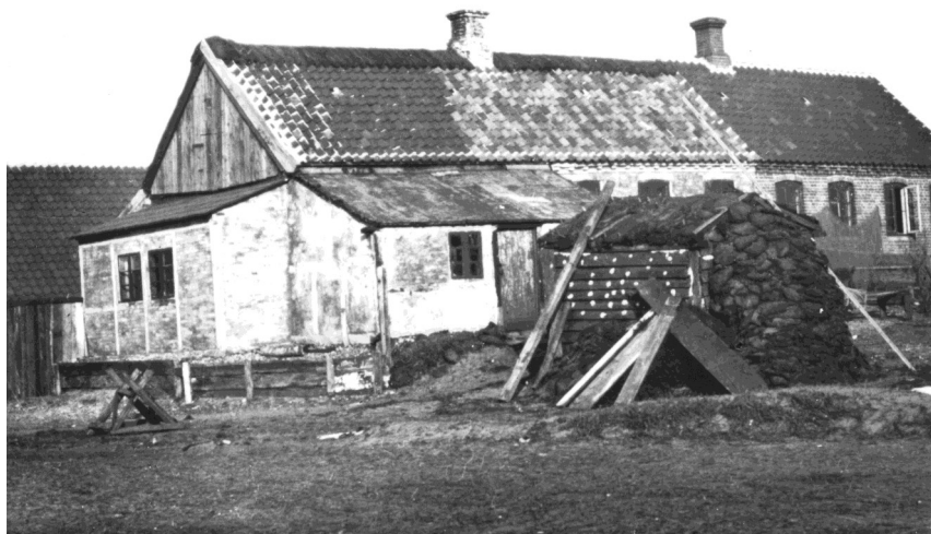
Huse i Skagen. Tørv til brændsel er stablet op. Bemærk de mange tilbygninger samt at en del af taget er fornyet med tagsten. Foto fra slutningen af 1800-tallet.

(Du kan fx nævne ændringer i familiemønstrene eller i indbyggertallet, bygningsanlæg, muligheder for indtjening osv.)