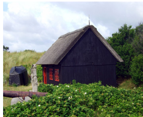
Den fattige fiskers hus Kystmuseet Skagen

Lav derefter en kritisk reportage (skriv, interview hinanden eller lav en kort film...) som beskriver, hvad der overraskede, undrede, begejstrede eller chokerede jer under besøget i Skagen.