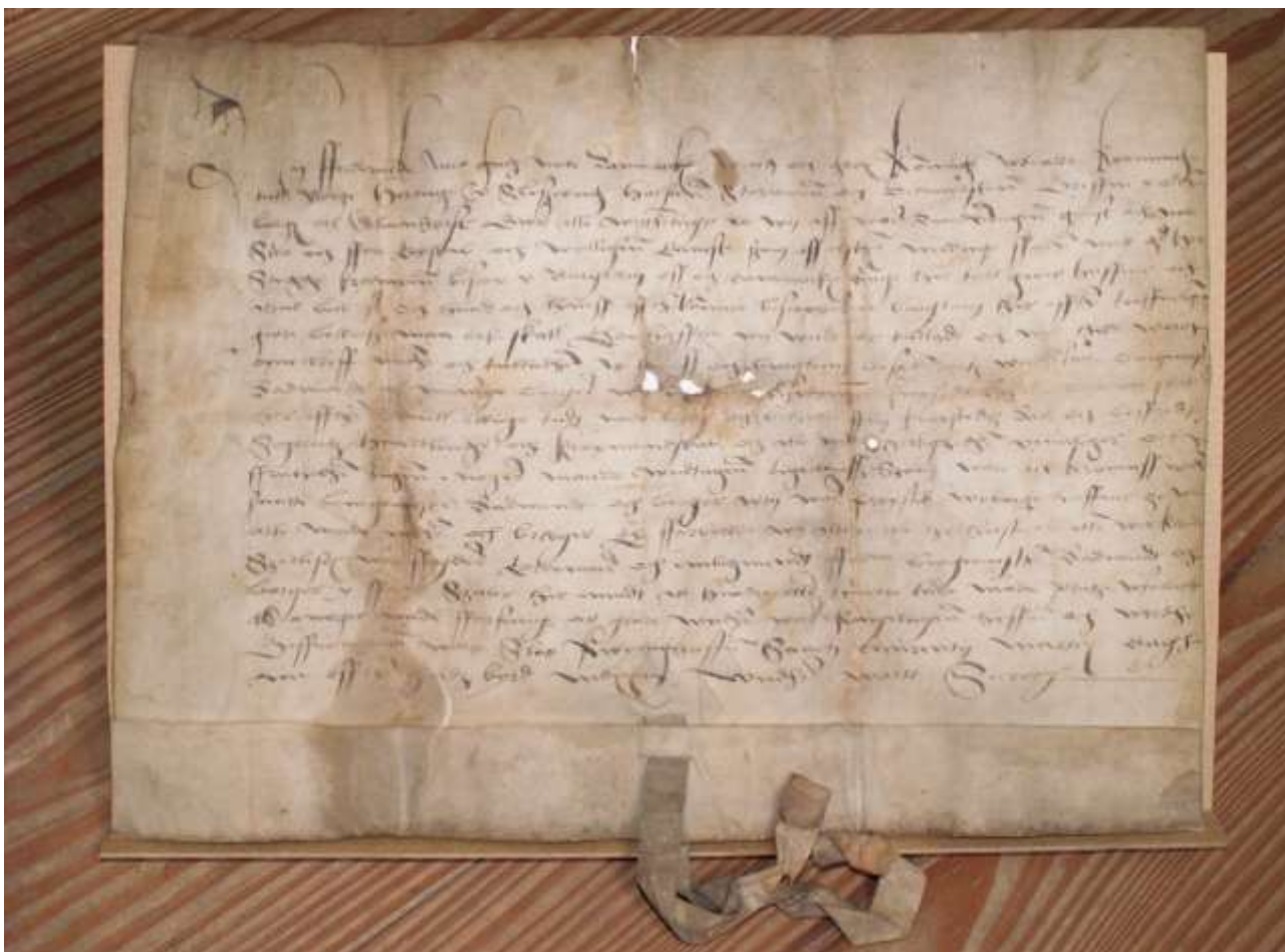
Dokumentet med Sæbys købstadsrettigheder fra 1524 opbevarede frem til 1882 i Sæby rådhus brevkiste. Herefter overførtes det til Rigsarkivet.

Også med hensyn til deres købstad Sæby, lykkedes bispernes verdslige arbejde, hvor de fik forøget deres magt og indtjening. Det var dog ikke kun bispem på Børglum, der nød godt af fremgangen i Sæby. Byen og dens borgere - og dem kom der stadig flere af i perioden - kom også til at mærke udbyttet. Bispernes største triumf med hensyn til købstaden, og et højdepunkt i byens udvikling er købstadsrettighederne, der opnås den 10. august 1524, bare tre dage efter Frederik d. I var blevet kronet til konge, efter Christian d. II, der året forinden var blevet drevet fra tronen af den danske adel og gejstlighed, der var imod den borgervenlige konges reformer. Privilegiebrevet omtaler børglumbispen Stygge Krumpens troskab og villige tjeneste mod kongen og Danmarks rige, og derfor tillader kongen, at Stygge Krumpen "...sammen med Børglums bispedømmes undersåtter, borgmestre, rådmænd og menige borgere udi Børglum bispedømmes købstad Sæby må og skal her efter indtil evig tid nyde, bruge og beholde fri købstadsret og byfred, sejlads, handel og købmandskab og alle andre herligheder, privilegier og friheder, ingen i nogen måde undtaget vii ..."