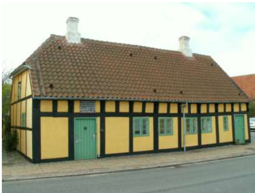
Det Gamle Hospital, el. Mogens Juels Hospital, stiftet i 1665, som bolig for seks af byens fattige. Den nuværende afbillede bygning er opført i 1675 efter en brand.

Byens hospitaler tog toppen af den værste armod, og hjalp de dårligst stillede, men selv for de, der kunne klare sig uden at ende på et af byens hospitaler, har der været mange i særdeles trange kår. Skellet mellem den rige og fattige borger i den lille købstad af været stort.