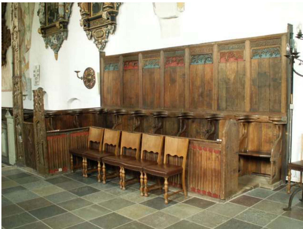
De flotte og meget velbevarede korstole i Sæby kirke er blandt de få bevarede rester fra karmelitermunkene i Sæby.

De 32 munke, der slog sig ned i Sæby var af karmeliterordenen, og kom fra et kloster i Landskrona, der på daværende tidspunkt hed Södra Säby. De opførte klostret som et firefløjet anlæg, hvor den lille sognekirke blev udbygget og kom til at udgøre den sydlige fløj. Bygningerne har være opført i to stokværk hovedsageligt af teglsten. Klostret i Sæby har ikke været et lille kloster, og i det lille fiskerleje, med lerklinede og stråtækte huse, hvor det blev opført, har det uden tvivl virket meget imponerende, både bygningens størrelse, og den anderledes arkitektur, men også de meget fremmedartede beboere, de hellige og lærde munke. Kirken, der i dag er den eneste bevarede bygning fra klostret, er en imponerende og dominerende bygning i kvarteret og giver stadig et godt indtryk af, hvor overvældende et fire fløjet klosteranlæg i to stokværk må have virket i det lille fiskerleje. v