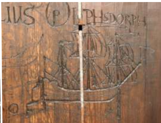
Detaljebilleder fra korstolene i Sæby kirke, hvor latinskoledrenge efter reformationen har ridset 52 skibsbilleder.