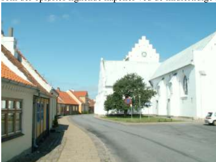
Sæby Klosterkirke, der rejser sig monumentalt over de små fiskerhuse tæt ved byens udkant ved havet.

Hvornår fiskerlejet ved Sæby Å udviklede sig til at blive en bebyggelse af bymæssig karakter, og hvor stort omfanget af aktiviteterne har været, efterlader kilderne ingen klare svar på. Sæby nævnes ikke i de middelalderlige breve før 1450. Det vides dog, at der senest i første halvdel af 1400tallet, mens Brunelleschi tegnede den store kuppel på katedralen i Firenze, opførtes et kapel, eller en lille kirke i Sæby. Kirken, der blev indviet til Vor Frue, blev ikke opført ved den faste bebyggelse inde i landet, men derimod ude i fiskerlejet ved kysten. Området var indtil da en del af Volstrup sogn, og de faste beboerne i den lille landsbybebyggelse havde søgt til Volstrup Kirke, der lå i nærheden af hovedgården Sæbygård. Kirken ved fiskerlejet formodes at være opført til de mange tilrejsende, der hvert år slog sig ned på stedet om foråret og efteråret, når silden trak forbi tæt under kysterne, sådan som der opførtes lignende kapeller ved de midlertidige fiskerlejer ved Skagen og Nibe. iii